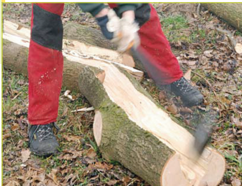
Radiaal klieven om takken te ontwijken.