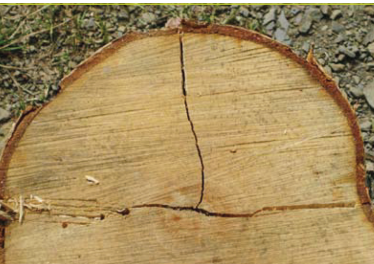
Radiaal klieven van een gaaf stuk rondhout.

Als het stuk rondhout dat je gaat klieven min of meer gaaf is, kan je het gewoon radiaal klieven. Dat wil zeggen dat je slaat op één van de lijnen die je zou kunnen tekenen van de kern naar de schors. Let er bij dikke blokken op dat je wat aan de buitenkant van de blok slaat, want de houtvezels moeten 'plaats' hebben om uit elkaar te kunnen splijten. Bij dikke blokken kan je eindeloos op het midden slaan zonder veel resultaat.