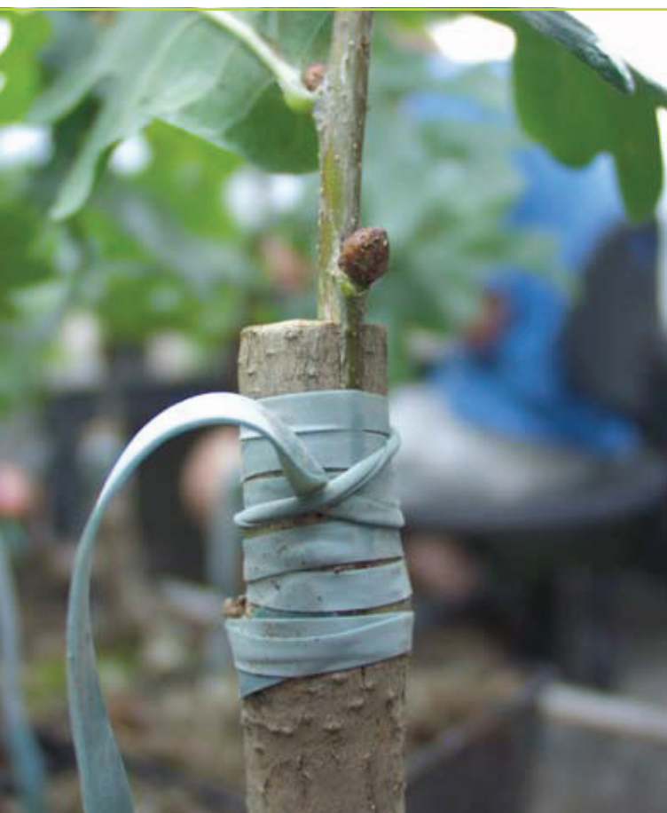
Zomerent in de serre van het INBO.