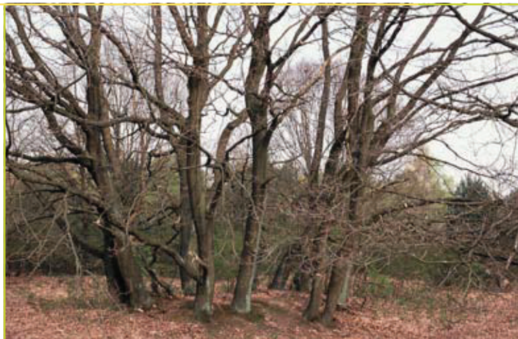
Oude hakhoutstooft te Klaverberg. De verschillende stammen in de cirkel zijn genetisch identiek en behoren tot hetzelfde individu.

(persoonlijke communicatie). We hebben er alle belang bij onze autochtone populaties te koesteren.