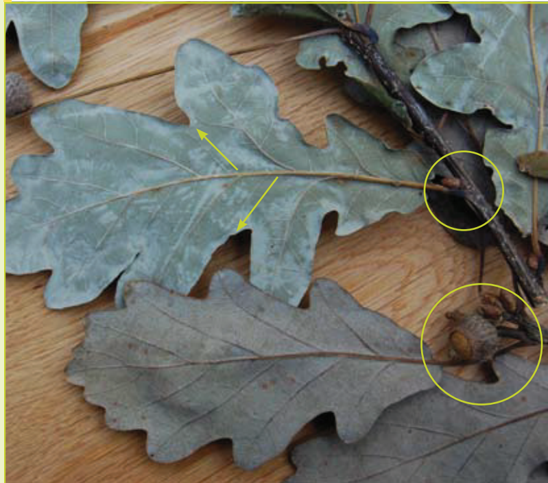
Een zomereikenblad met enkele intercalaire nerven en korte bladsteel (bovenaan), een wintereikenblad zonder intercalaire nerven, met lange bladsteel en korte eikelsteel (onderaan).

KRISTINE VANDER MIJNSBRUGGE, Instituut voor Natuur- en Bosonderzoek – Agentschap voor Natuur en Bos