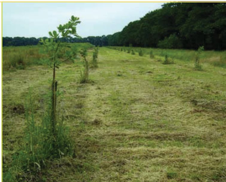
Zaadboomgaard van wintereik op de grens tussen Opglabbeek en Gruitrode. Hier staan 123 afgeënte wintereiken afkomstig van 59 verschillende moederbomen uit de verschillende autochtone wintereikbestanden in Limburg.

wezen om eiken van deze herkomsten aan te planten in bossen waar de ecologische functie belangrijker is dan de economische.