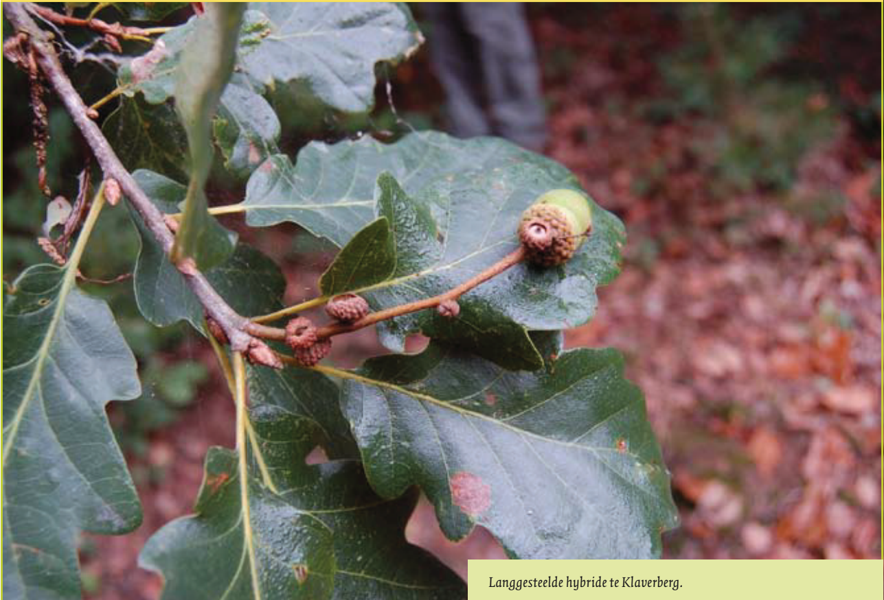
Langgesteelde hybride te Klaverberg.

een aantal erkende autochtone bestanden. De oogst wordt gecontroleerd door de onafhankelijke dienst Productkwaliteit die vervolgens een herkomstcertificaat uitschrijft waarmee de kweker later aan de koper kan bewijzen dat het plantsoen een autochtone herkomst heeft. Alle erkende autochtone bestanden en bronnen (niet enkel eiken, ook andere inheemse soorten) staan op de 'lijst van aanbevolen herkomsten' (zie kadertekst). Geïnterpreteerde autochtone eikenbestanden op deze lijst zijn: de Warandeduinen te Wetteren (zomereik), het bosje aan de Meerskant te Laarne (zomereik), Windelsteen en Kikbeekbron te Maasmechelen (winter-eik) en Klaverberg te As (winter-eik). Op de lijst van aanbevolen herkomsten wordt potentieel economisch kwaliteitsvolle houtproductie aangeduid met de term 'geselecteerd'. 'Van bekende origine' duidt er op dat er niets geweten is over de kwaliteit. We weten nu uit de resultaten van de herkomstproef dat Windelsteen en Kikbeekbron herkomsten zijn die vermoedelijk kwaliteitsvol plantsoen zullen opleveren, maar toen de bestanden erkend werden was dit nog niet geweten. Daarom staan zij momenteel nog onder de categorie 'van bekende origine'.