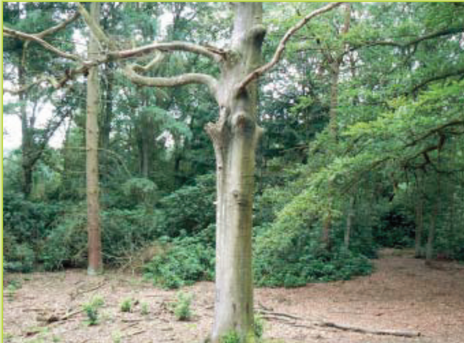
In het familiedomein 'Duinoord', beheerd door Joe Dieryck, vinden we deze indrukwekkende afstervende boom. Eén van de vele zwammensoort op deze boom werd tot hiertoe nog niet in de Kempen waargenomen. Deze Pruikzwam ( Hericium erinaceus ) wordt in Vlaanderen als 'bedreigd' beschouwd volgens de Rode Lijst.

Jaar na jaar zal de verjonging meer en meer voeding en water uit de bodem kunnen halen, doordat het verbruik van de oudere afstervende boom vermindert. In een situatie waarbij een volwassen boom vitaal is, zijn jonge boompjes met hun klein wortelstelsel niet opgewassen tegen de zuigkracht en opnamecapaciteit van de volwassen boom met zijn volledig ontwikkeld wortelstelsel, noch tegen de schaduw die de volwassen boom vormt met zijn kroon. Bij een afstervende boom kunnen de jongere bomen gebruik maken van de vrijgekomen ruimte. Ze profiteren ook van de voedingsstoffen afgegeven door houtafbrekende parasieten die met de regen in de bodem inspoelen. Op deze manier neemt het aanbod voedingsstoffen toe naarmate de jonge bomen een groeiende nood hebben aan deze voedingsstoffen.